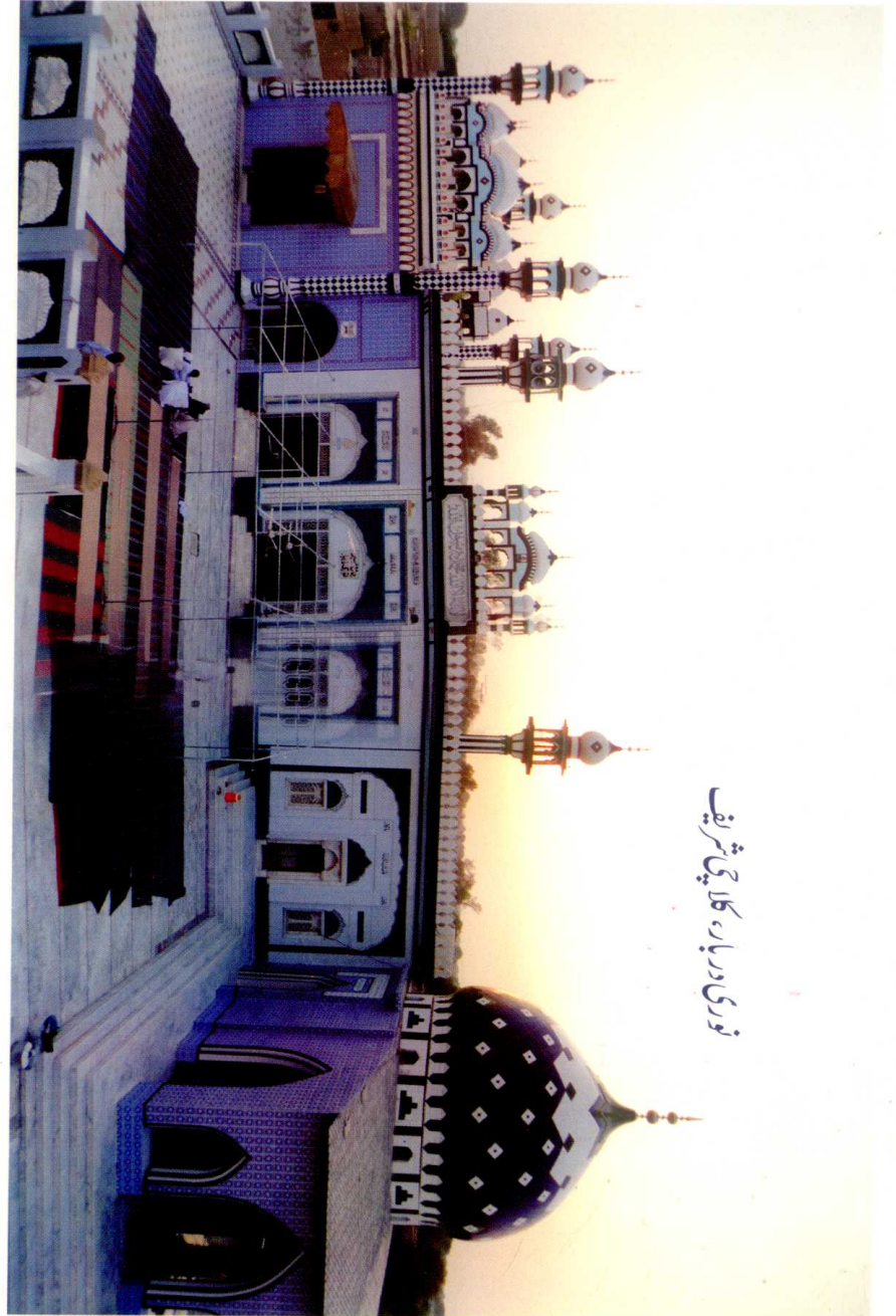
نوری دربار، کلاچی شریف

موجودہ خلائی اور جوہری (ایٹمی) عہد میں مادیت کو جو عروج اور فروغ حاصل ہوا ہے اس نے لوگوں کے ذہنوں کو یکسر بدل دیا ہے۔ آج اکثر لوگ مذہبی کتابوں اور روحانی موضوعات کو طویل، خشک اور پیچیدہ مسائل کا مجموعہ سمجھ کر ان کے مطالعے سے گریز اور پہلو تہی کرتے ہیں اور وہ اپنے اس خیال میں کسی حد تک حق بجانب بھی ہوتے ہیں کیونکہ عموماً ایسا ہی ہوتا ہے۔ آج دنیا اس مقام پر نہیں جہاں صدیوں پیشتر تھی۔ انسانی علم اور تجربے نے آفاق کی وسعتوں کو چھان مارا ہے۔ اب اس خاک کی نژاد انسان کے قدم چاند اور ستاروں کی