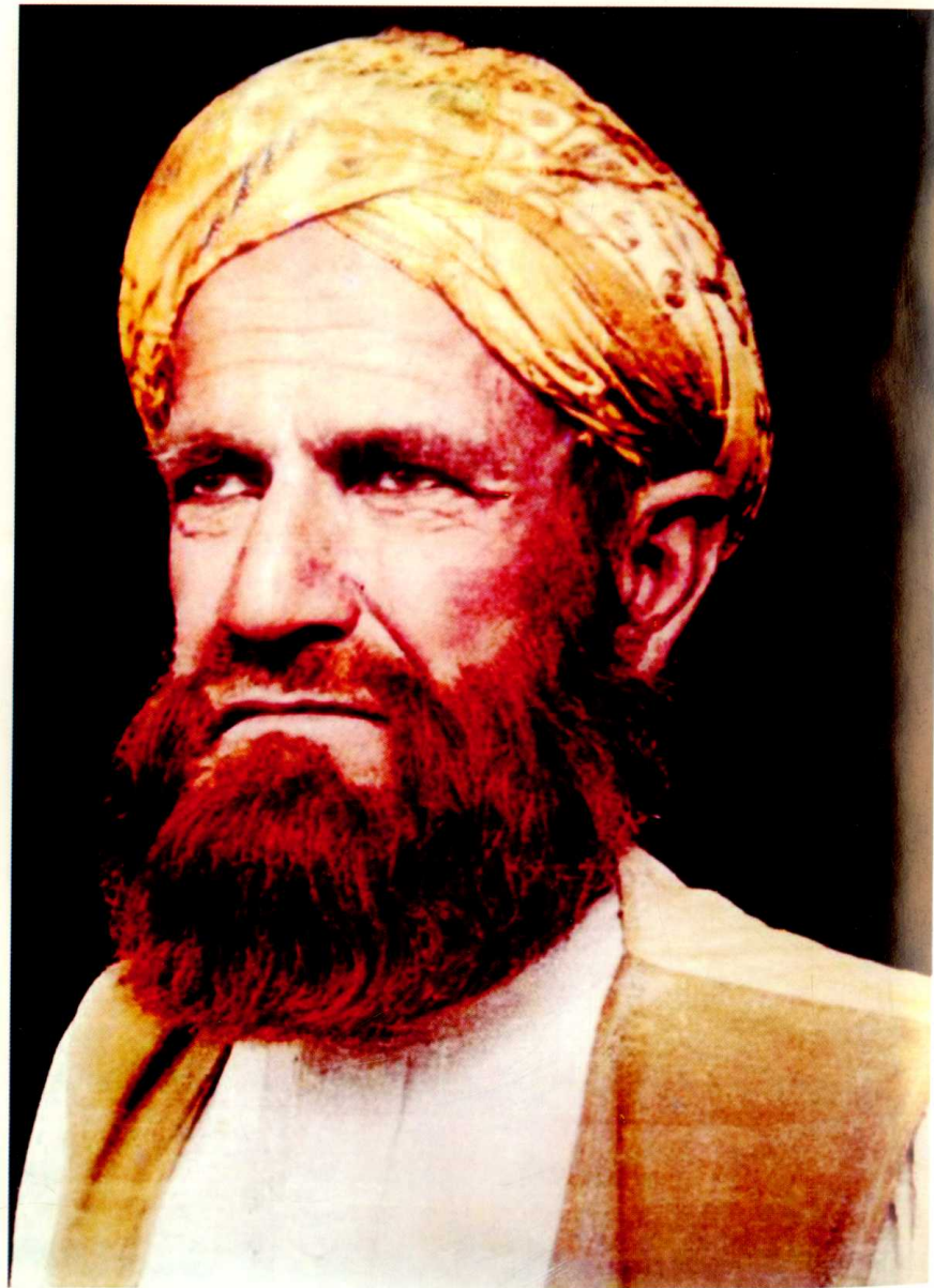
حضرت قبلہ فقیر نور محمد سروری قادری کلاچوی رحمۃ اللہ علیہ